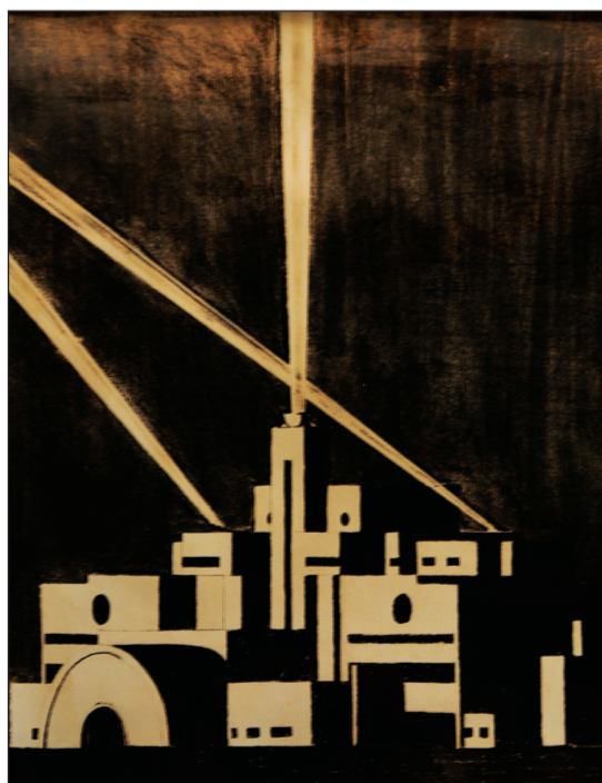
Projeto do Palácio do Governo do Estado: catapultas e bateria antiaérea

Detalhe: no cenário havia um totem, de alumínio. A Bial de São Paulo, que começa em 25 de setembro, convidou José Celso Martinez e o Teatro Oficina para reencenar a peça na casa de Valinhos, com transmissão ao vivo para o pavilhão no Ibirapuera. Vale saber, por fim, que Flávio de Carvalho também filmou as expedições que fez à Amazônia. As fitas, inéditas, foram digitalizadas através de uma parceria com a TV Cultura e com a Fundação Bial de São Paulo. “Além de maletas especiais, ele projetou tambores de alumínio para transportar o material de filmagem. A intenção era a de mergulhá-los no rio para mantê-los em temperatura constante. As imagens das expedições testemunham, entre outras coisas, o primeiro contato com uma tribo do alto rio Negro.”