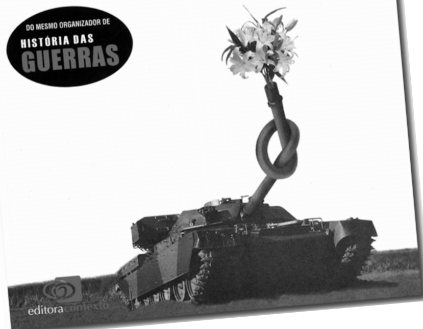
Capa do livro História da Paz : artigos de 15 especialistas

DO MESMO ORGANIZADOR DE HISTÓRIA DAS GUERRAS