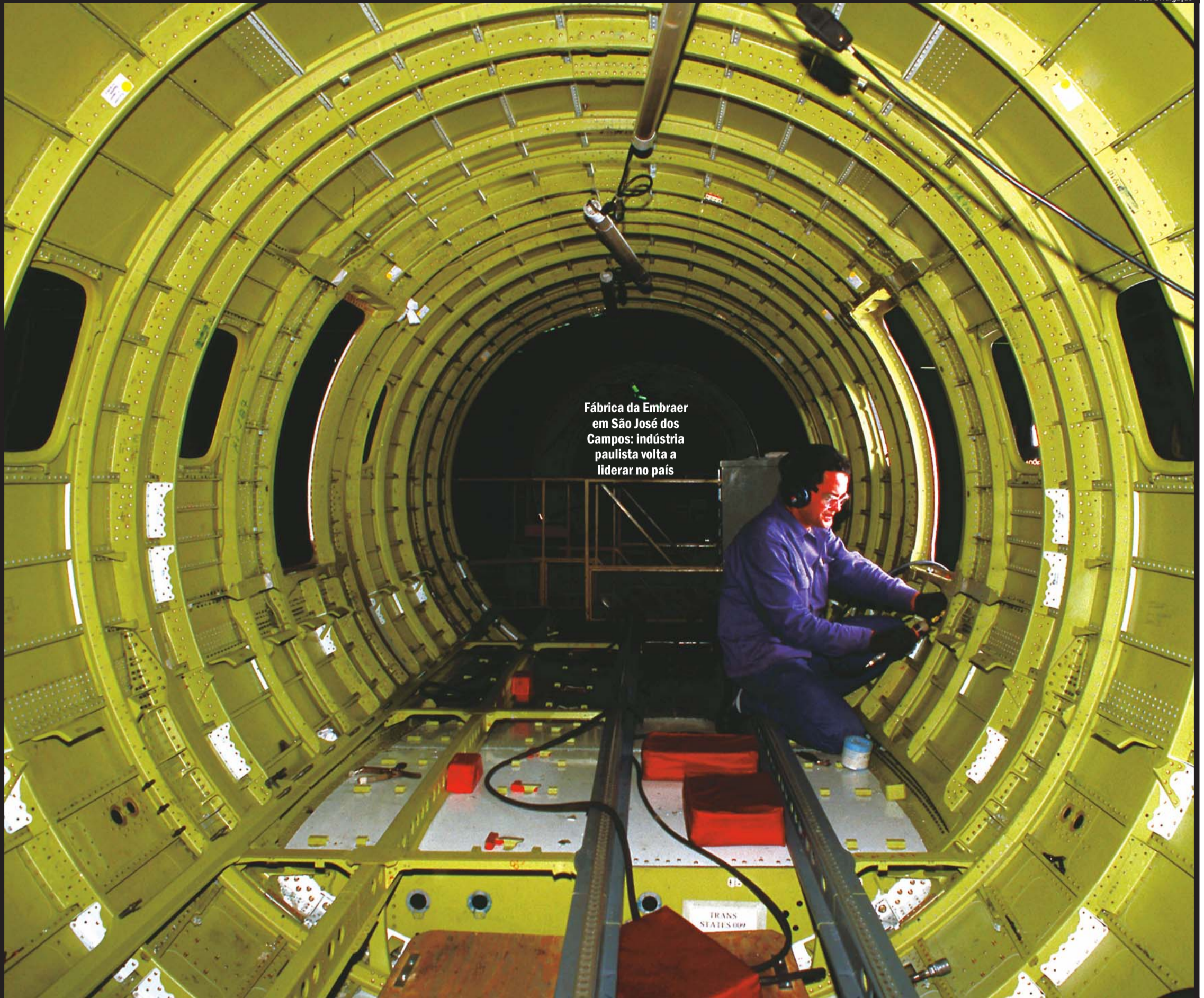
Fábrica da Embraer em São José dos Campos: indústria paulista volta a liderar no país

A indústria paulista, que vinha apresentando taxas de crescimento industrial inferior à média do país e perdendo em dinamismo para alguns Estados, voltou a puxar a economia brasileira. Este é um dos resultados de um amplo diagnóstico constituído por 26 estudos setoriais sobre as atividades produtivas mais relevantes, entregue por Unicamp, USP e Unesp ao governo do Estado de São Paulo, por encomenda da Secretaria de Desenvolvimento. O projeto "Agenda de Competitividade para a Indústria Paulista" indica que a indústria brasileira retomou sua posição de motor da economia no biênio 2006-2007, com São Paulo à frente. E recomenda uma série de medidas para que a indústria paulista assegure sua competitividade na concorrência com outros países emergentes, principalmente os asiáticos. Página 3