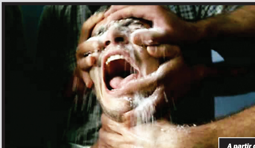
A partir do alto, em sentido horário, cenas de Zuzu Angel , Ação entre amigos , Nunca fomos tão felizes , Corpo em delicto , de novo Zuzu Angel e A terceira morte de Joaquim Bolívar : duplo processo de seleção do passado

A pesquisadora notou em alguns filmes dos anos 1980, como Pra frente Brasil e O bom burguês , uma certa invisibilidade dos militares em envolvimento com a tortura, ao passo que, nos menos conhecidos, ela aparece como política de Estado. É o caso de Paula – a história de uma subversiva ,