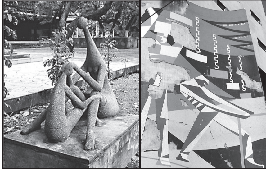
Iracema guardiã (alto), Jangadas (centro), Cafuné (acima, à esq.) e Estivadores, obras de Zenon Barreto analisadas na dissertação

cearense no cenário nacional. “Não fazia ideia de quanto a falta de informações poderia prejudicar o trabalho de resgate”.