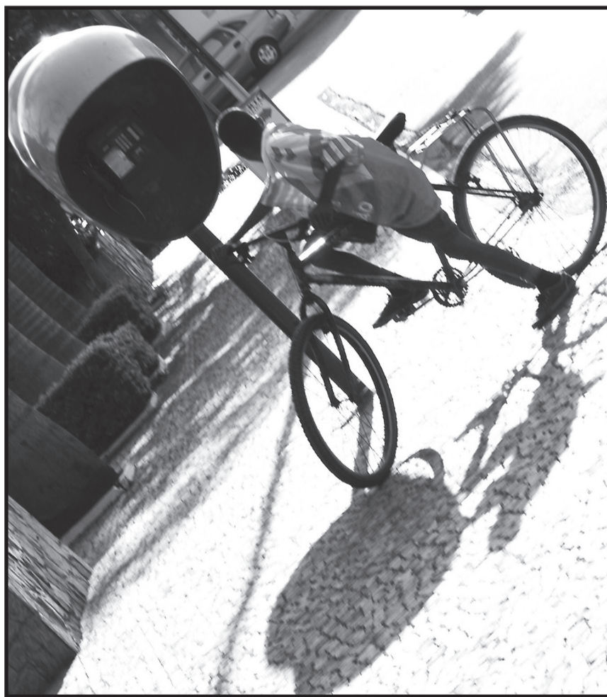
Acidentes com bicicletas envolvendo adolescentes são as principais causas de traumas, aponta a dissertação

Na radiografia sobre o perfil da população acidentada que recebeu socorro na FOP, os meninos na faixa etária de 11 a 15 anos se machucaram muito mais do que as meninas da mesma idade. No total, 31,5% dos atendimentos foram dedicados