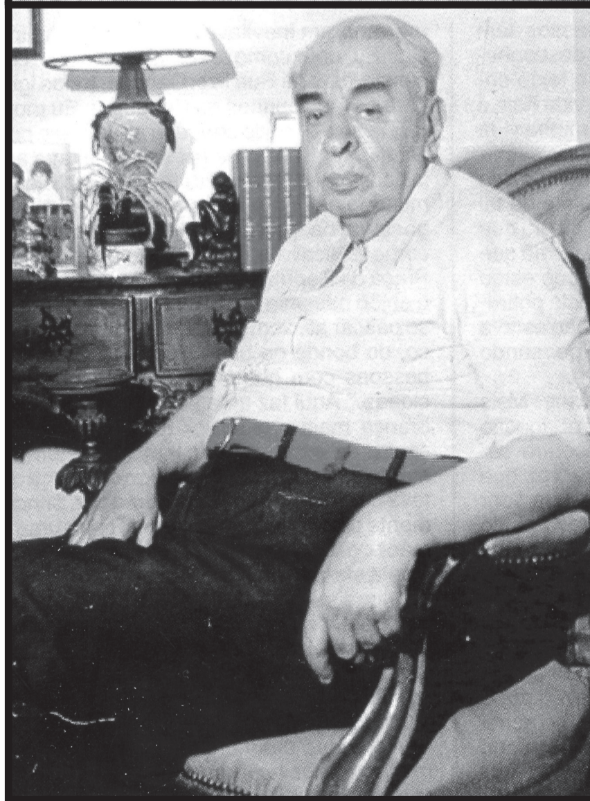
Nava caminhando no Rio (alto) e em sua casa (acima): textos com influências dos modernistas

cinco décadas depois da Semana Arte Moderna. Nos anos 20, Mário de Andrade registrou no "Prefácio Interessantíssimo", de Paulicéia Desvairada, e em A escrava que não é Isaura, que o realismo era uma concepção literária ultrapassada e que deveria dar lugar a algo novo. Todavia, ao escrever