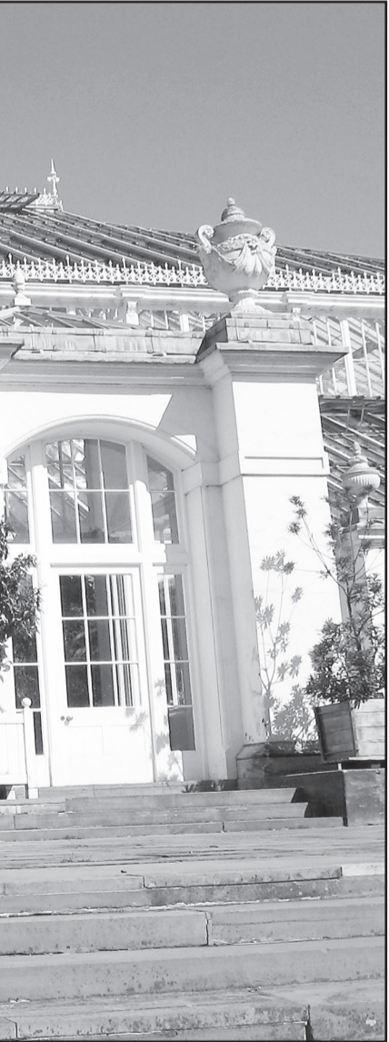
"jeito brasileiro de fazer ciência"