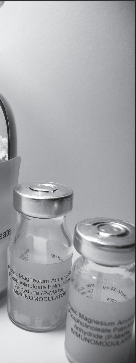
como "o remédio brasileiro contra a Aids"