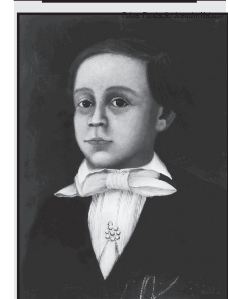
Joaquim Nabuco aos 8 anos, retratado em pintura a óleo feita no engenho Massangana, em 1857