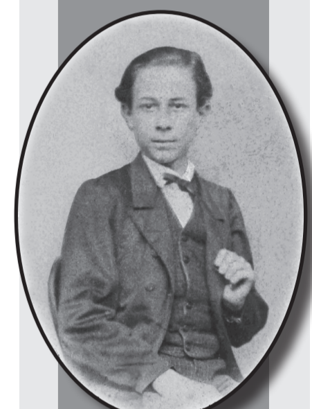
Aos 15 anos, em 1864, no Recife