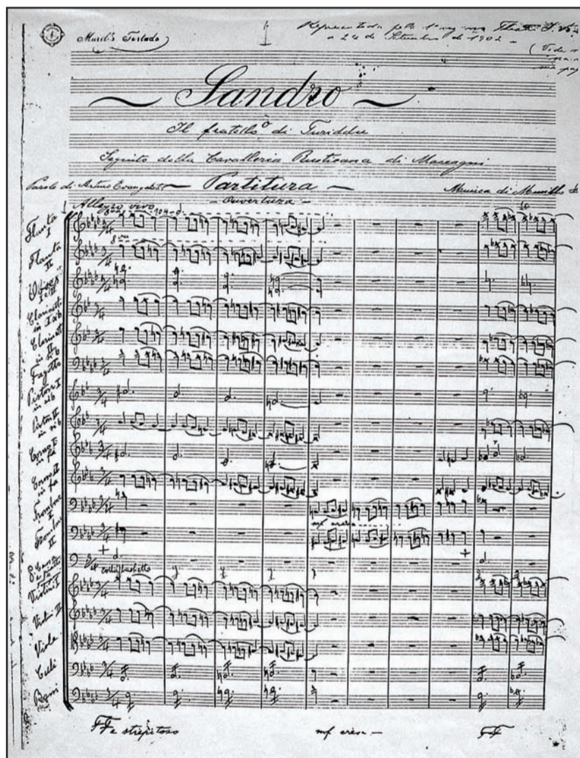
Primeira página do manuscrito da ópera: maestro recuperou o material, que estava em estado precário

O ponto crucial da pesquisa, segundo Takahama, é a reestrea da ópera e a perspectiva em relação à recepção crítica. Depois da fase instigante da análise e do estudo de sua direção musical, o autor constata que a responsabilidade do regente vai além de programar uma temporada baseada no repertório tradicional, ano