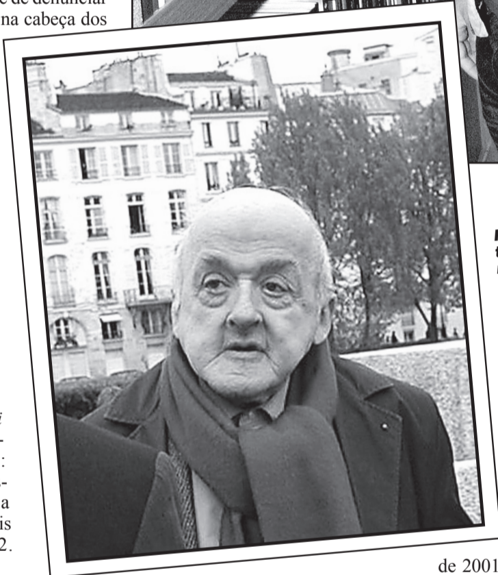
Pierre Seel: testemunho de repercussão mundial foi traduzido por Elídio

em 83 países, sobretudo na África. Desse total, sete países, Mauritânia, Sudão, Arábia Saudita, Irã, Iêmen, Nigéria e Somália, usam a pena de morte como condenação.