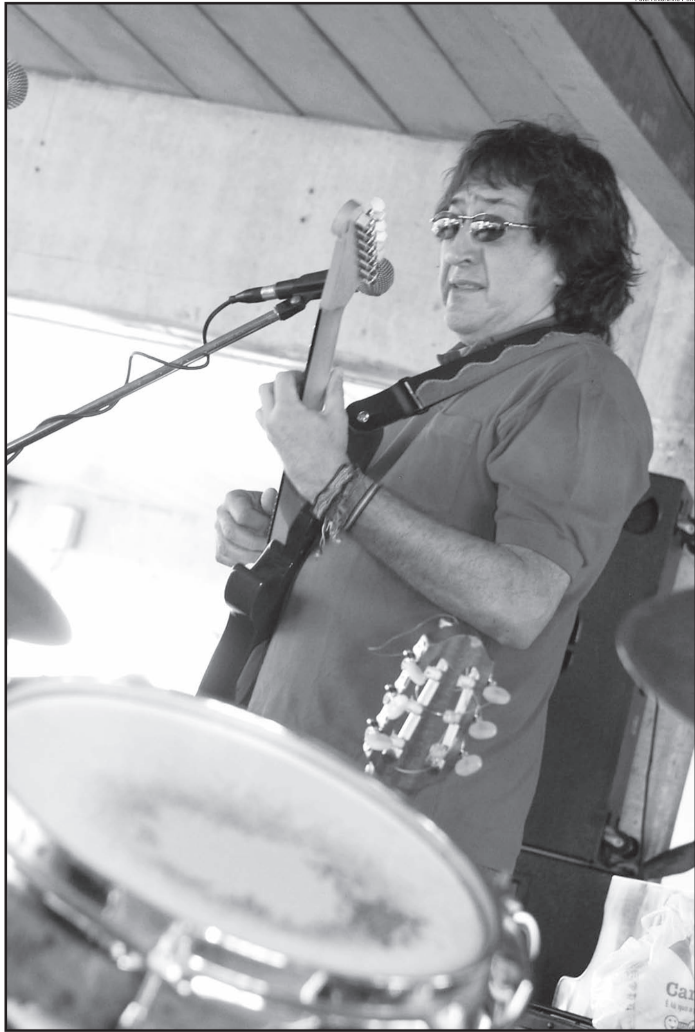
Toninho Horta, em show realizado no último dia 29 no Ciclo Básico II da Unicamp: legião de admiradores em Campinas

De um jeito simples e descontraído, Horta conta que a transformação da sonoridade violonística em som de orquestra, permitida pelas experimenta-