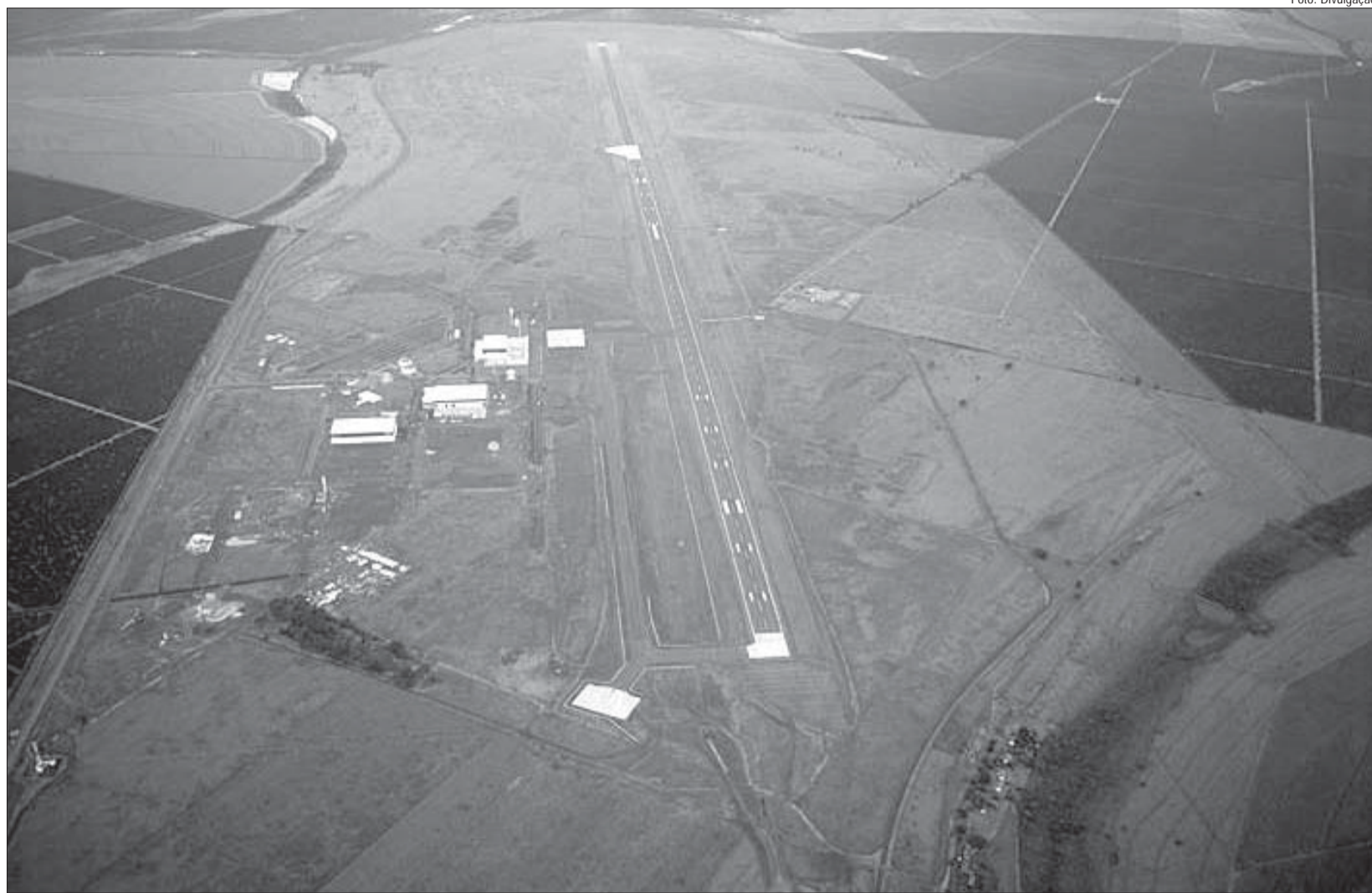
A maior pista privada para aviões do mundo, em Gavião Peixoto: planejamento estratégico é vital para a cidade encravada numa das regiões mais ricas de São Paulo.

O reitor Tadeu Jorge considera significativo o fato de um município