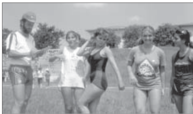
Primeiro exame seletivo da FEF, em março de 85, na Escola de Cadetes: no mês seguinte, o curso já funcionava

instalações esportivas da Escola de Cadetes do Exército, fora do vestibular integrado da Unicamp. No mês seguinte, o curso, ainda subordinado à Reitoria, já estava funcionando. Logo viraria faculdade, conforme previra D’Ambrosio, por meio de decreto estadual de 10 de julho de 1985. As instalações para as aulas teóricas eram precárias. A administração da nova unidade funcionava ainda no prédio da Atrefe. Havia pouco ali: dois vestiários, um ambulatório médico, uma sala onde funcionava a administração e outra para cuidar dos créditos. As aulas teóricas eram ministradas no Ciclo Básico. Iniciou-se a construção do prédio principal da unidade, que seria inaugurado em abril de 1986.