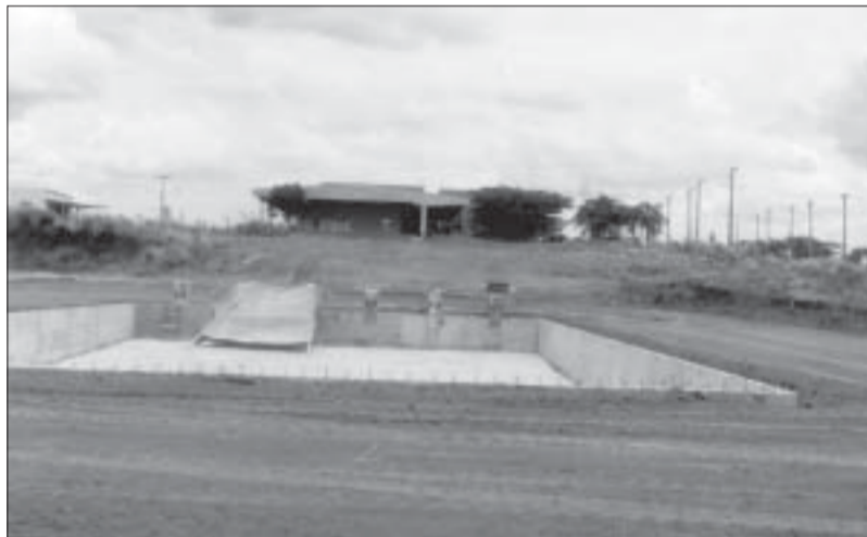
A piscina em construção no final dos anos 80: período de consolidação da unidade

Faculdade – Foi realizado a toque de caixa um exame seletivo em março de 1985, sendo utilizadas as