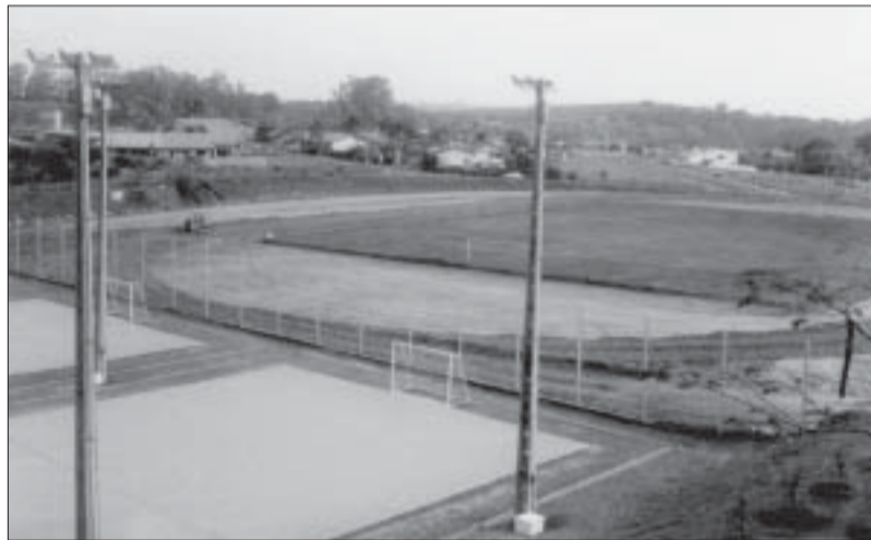
Visão das quadras e da pista em construção: frequência atual é de 2 mil pessoas/dia