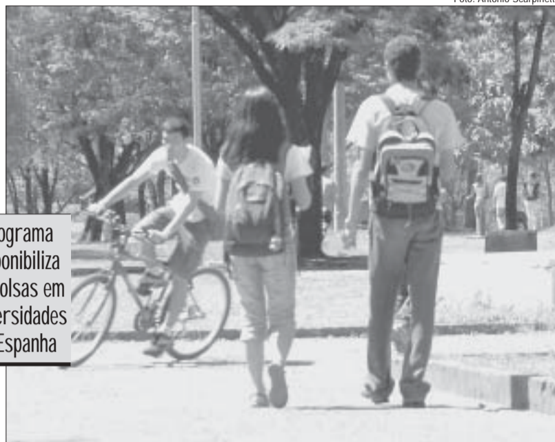
Programa disponibiliza 40 bolsas em universidades da Espanha

A inauguração do Posto de Mobilidade Estudantil, ocorrida em agosto, tem como objetivo facilitar o acesso dos estudantes aos pro-