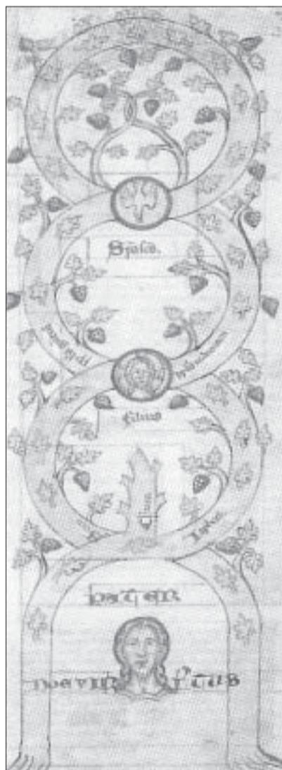
Na seqüência, As três idades do universo segundo Joaquim de Fiore (1130-1202), em ilustração do século XII; ilustração de L'homme dans la lune (1638), de Francis Godwin; e Naufrágio de um louco solitário, de Albrecht Dürer