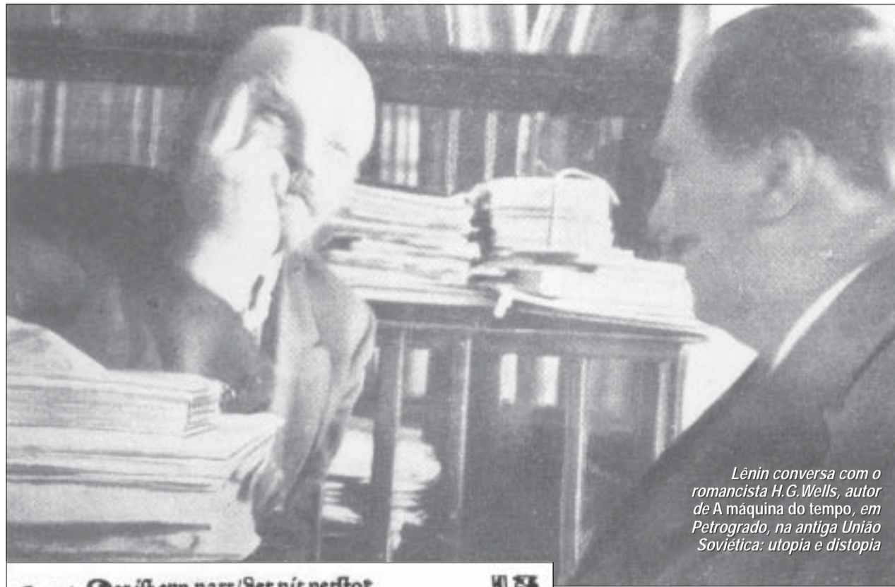
Lênin conversa com o romancista H.G. Wells, autor de A máquina do tempo , em Petrogrado, na antiga União Soviética: utopia e distopia