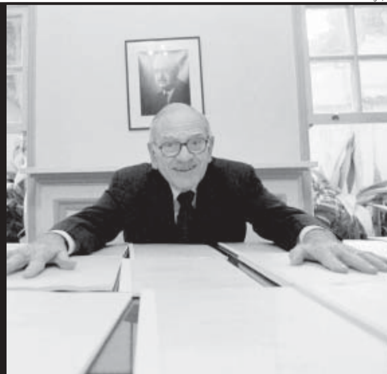
O sociólogo Helio Jaguaribe: "O intelectual precisa discutir a crise"